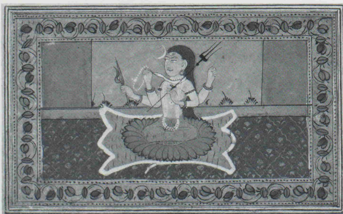
Miniatur Nr. 32

Alle Miniaturen sind im Maßstab 11 : 10 wiedergegeben